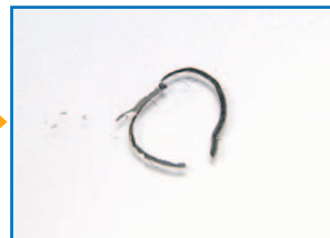
親水効果により、汚れが浮きます。