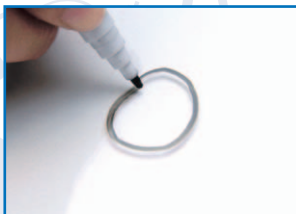
マジックで印をつけます。