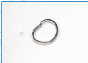
水を吹きかけます。