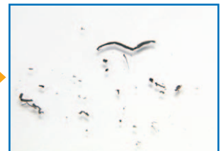
汚れがとれて流れます。